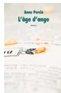
L'Ecole des Loisirs, Coll. Médium, 2008

Ils se sont rencontrés autour d'un livre qu'ils sont les seuls à emprunter à la bibliothèque de leur lycée, un gros livre vert qui raconte les amours des dieux et des héros grecs. Tout les sépare pourtant. D'un côté, le personnage qui raconte l'histoire, qui a l'aisance des beaux quartiers, à qui tout réussit mais qui ne parvient pas à s'intégrer. De l'autre côté, Tadeusz, fils d'ouvrier polonais immigrés, qui habite la banlieue et fait du foot. C'est pourtant dans cette rencontre explosive que chacun va se révéler à lui-même. Une histoire d'amitié sur fond d'émeutes de banlieue qui tourne au tragique.