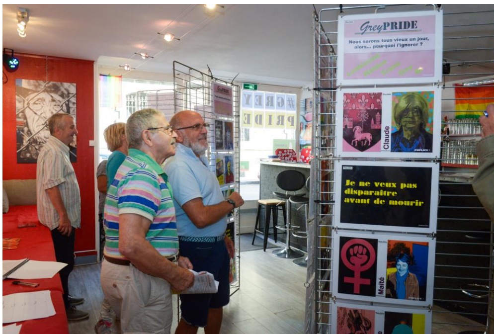
Exposition à l'espace Txalaparta à BAYONNE en octobre 2016